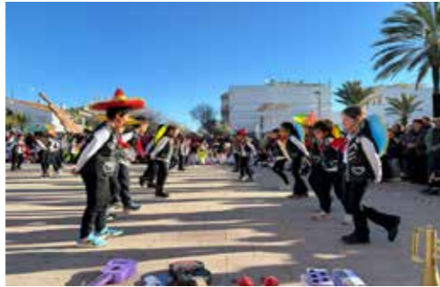
Infants de Mitjans ballant una ranxera

Aquest última celebració de la festa del Carnaval va ja va ser encamida amb aquesta mirada. Tot i que no és gens fàcil canviar costums i maneres de fer, ja hem començat