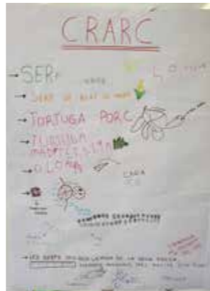
Llençol on es recull el què ha cridat més l'atenció al CRAC de Masquefa

Val a dir però, que realment el context és una excusa per reflexionar sobre el món, per posicionar-nos com a persones i per construir coneixement conjuntament amb els altres. En cada Pregunta es programen una successió de situacions que ens porten ca a llegir, a escriure, a calcular, a mesurar... i a reflexionar sobre què aprenc i com ho he après. Situacions d'aprenentatge ben riques, que s'acaben amb una Comunicació a les famílies o amb un Mosaic, també per les famílies i bé pels mateixos infants de la Comunitat. Estigueu alerta perquè ben aviat us farem arribar les dates. Totes les famílies hi sou convidades!