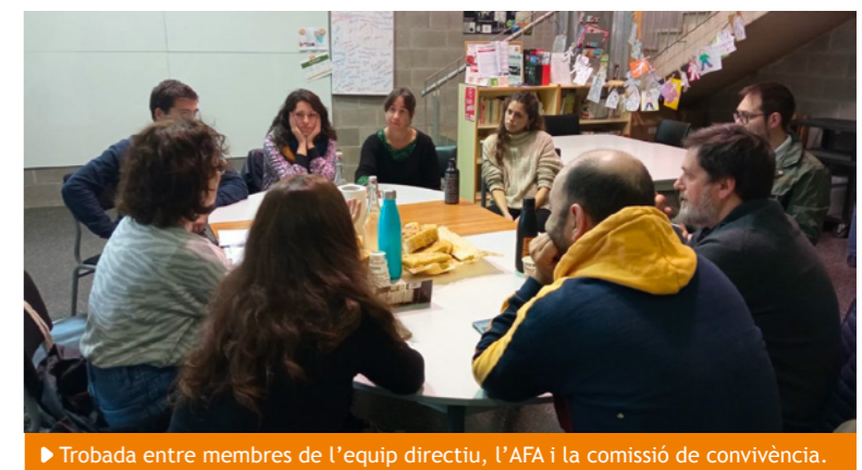
Trobada entre membres de l'equip directiu, l'AFA i la comissió de convivència.

Als centres educatius comptem amb la Comissió d'Atenció Educativa Inclusiva (CAEI). De fet, fins fa quatre dies, en dèiem la Comissió d'Atenció a la Diversitat (CAD). És l'estructura organitzativa que tenim les escoles per gestionar les mesures i els suports que ens donen des del Departament d'Educació per poder ajustar les pràctiques educatives a les necessitats de tot l'alumnat. Sobretot, per a aquelles persones que presenten necessitats educatives especials, encara que a l'Escola Riera de Ribes sabem que la realitat és complexa i que tothom és especial. Les trobades entre els membres de la CAEI són setmanals. Les persones que la conformen a la nostra escola són: la mestra referent d'Educació Especial de cada comunitat, la psicopedagoga de l'Equip d'Acompanyament Psicopedagògic (EAP) del Departament d'Educació i la cap d'estudis.