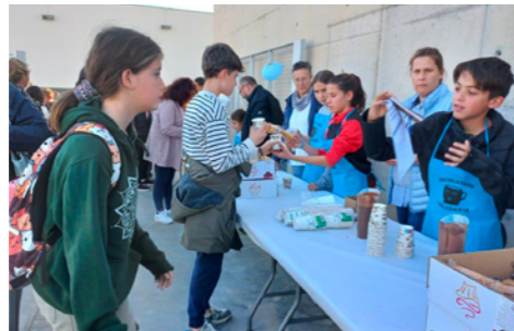
► Xocolatada solidària d'enguany organitzada pels alumnes i famílies de 6è.