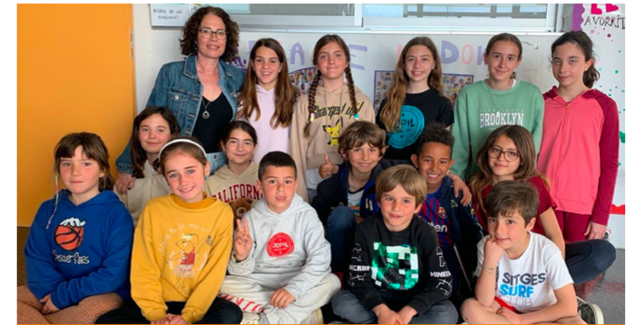
► Foto de família dels representants de l'alumnat amb la directora de l'escola.