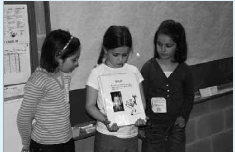
CEIP RIERA DE RIBES

Imatge 1. El valor d'aprendre compartint des de la cultura de cadascú, afrontant problemes i assumint riscos