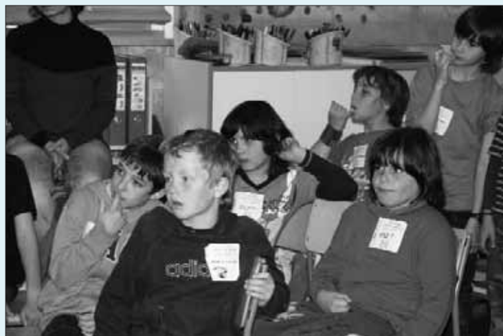
CEIP RIERA DE RIBES

Imatge 2. El context fa que les experiències esdevinguin interessants i generin aprenentatges clau, fomentant l'esperit crític