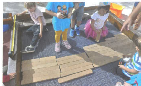
Començant a emplenar amb els blocs de fusta la futura zona enjardinada