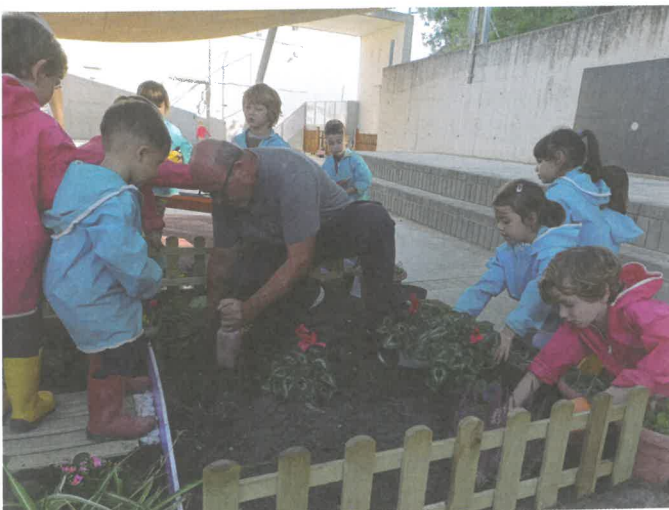
Expert jardiner treballant amb els nens i les nenes fent el trasplantament de les plantes.

Després de tan sols un mes amb el jardí en funcionament, les plantes atrauen tota mena d'insectes: abelles, formigues, un insecte bastó, i fins i tot un gripau petit. Quantes sorpreses més (i oportunitats d'aprenentatge) ens oferirà el jardí?