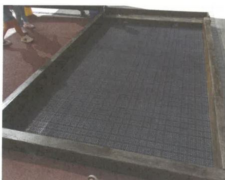
Fotos de la font amb l'inici de la canal i piscina final on anava a parar l'aigua del racó de ciència de la comunitat de xics. Aquí hi haurà el jardí