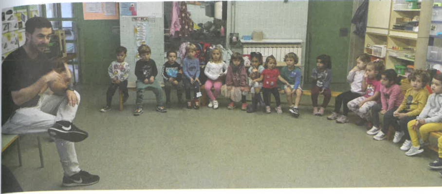
Les Merles i les Genetes estan atents i atentes durant l'entrevista a l'expert, que els explica com cal cuidar les plantes. És enriquidor que l'alumnat pugui sentir un vocabulari professional i no infantilitzat, però sí que és adequat a l'edat per a més comprensió

tre la possibilitat que les famílies puguin col·laborar als projectes, i ja és habitual que aquestes s'ofereixin a participar.